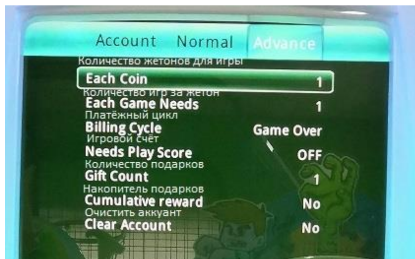
Таблица значений к настройкам